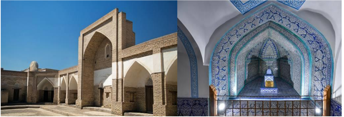
นำท่านเข้าชม ที่ฝังศพของพาร์ราวาน มัคหมุด (Pahlavan Mahmud) ถูกสร้างเป็นโดม สีฟ้าเพียงแห่งเดียวเท่านั้น