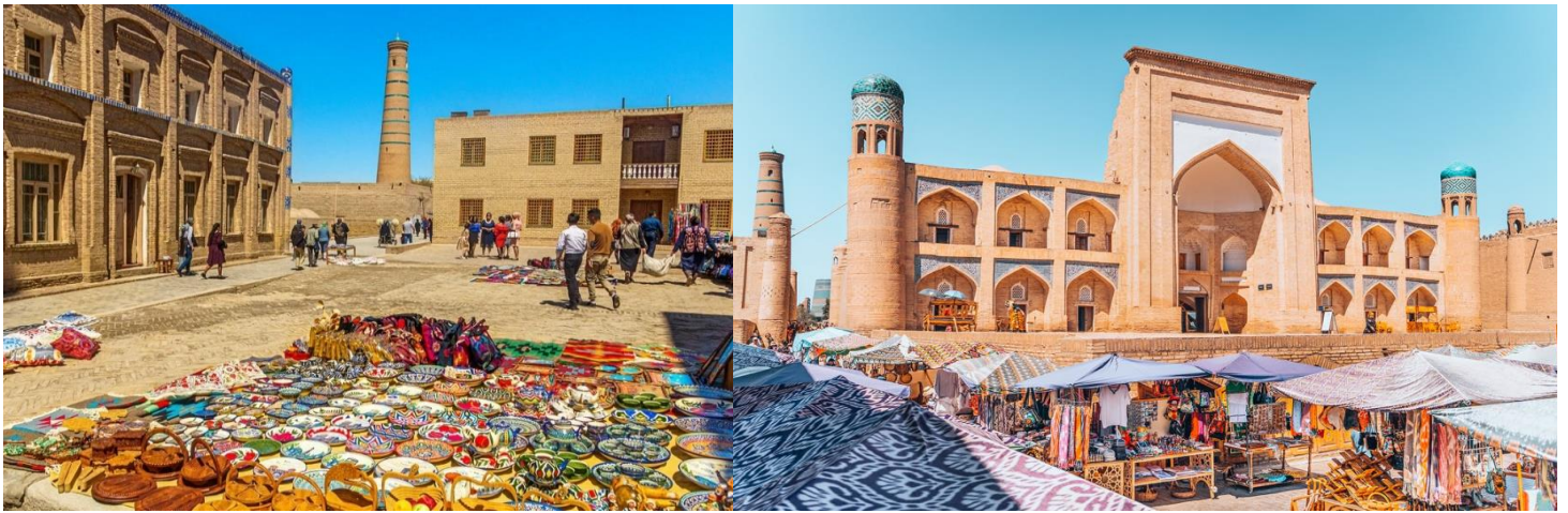
ชม แหล่งช้อปปิ้งพาลวานคอรี่ (Palvan Kori) ที่เป็นศูนย์กลางค้าขายของคาราวาน ซึ่ง ในช่วงศตวรรษที่ 18 กองคาราวานได้ใช้สถานที่แห่งนี้เป็นที่หยุดพักหลังจากเดินทางมา แรมไกลจากเอเชียไปทางด้านตะวันตกและก็กลับมา และยังเป็นจุดที่มีการแลกเปลี่ยน สินค้าต่างๆ อีกด้วย