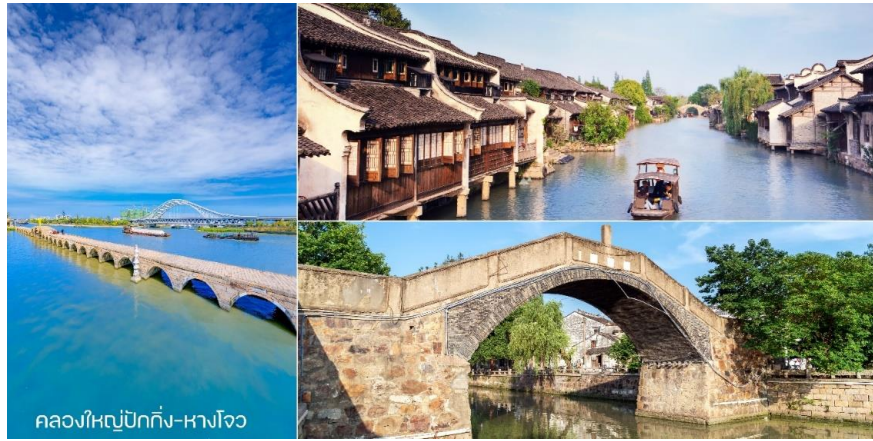
คลองใหญ่ปักกิ่ง-หางโจว

กลางวัน บริการอาหารกลางวัน ณ ภัตตาคาร พิเศษ! ขาหมูเซี่ยงไฮ้