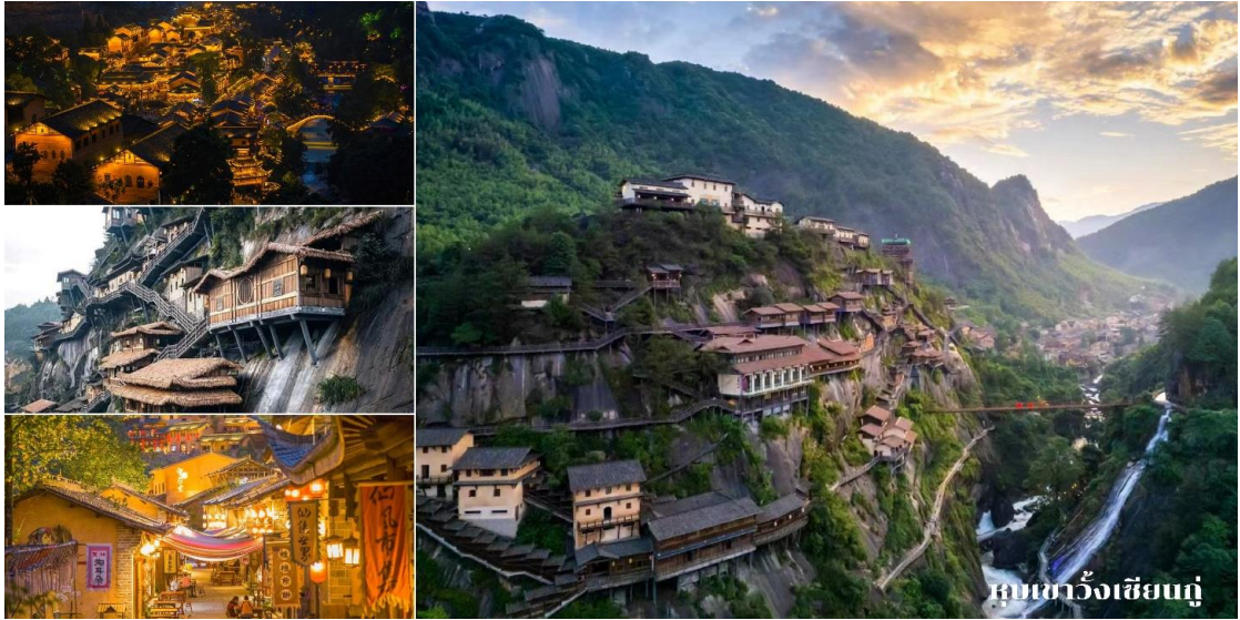
ที่พัก Shangrao jialaite Hotel 4* หรือเทียบเท่า

วันที่ห้า เดินทางสู่ ฉางซา (รถไฟความเร็วสูงG1403 09.44-12.36) - วัดโคฝู - ถนนคนเดินหวงซิง - สนามบินฉางซา-กรุงเทพฯ VZ3605 CSX-BKK 22.55 - 01.30+1