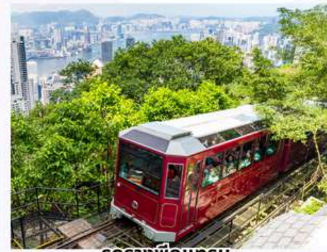
รถรางพิกแรม