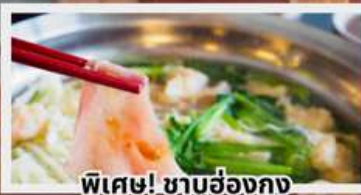
พิเศษ! ชาบูฮ่องกง