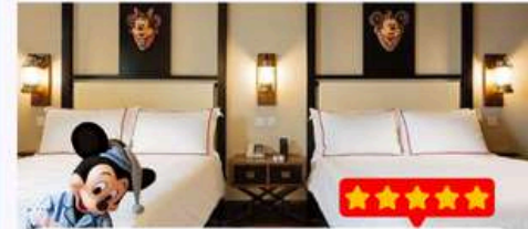
พัก Disney Explorers Lodge 5 ดาว 1 คืน