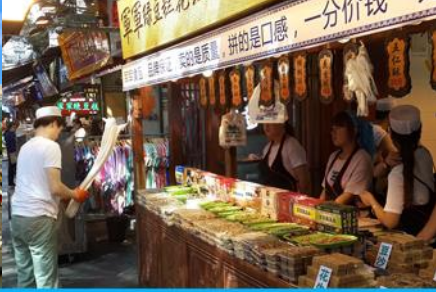
ตลาดมุสลิม