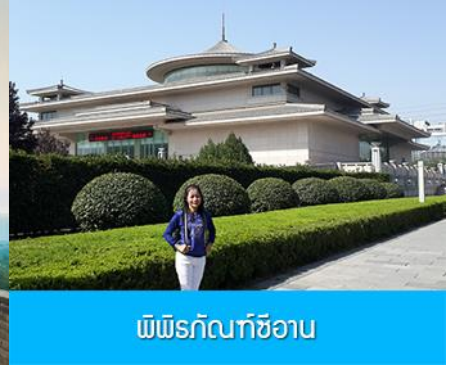
พิพิธภัณฑ์ซีอาน