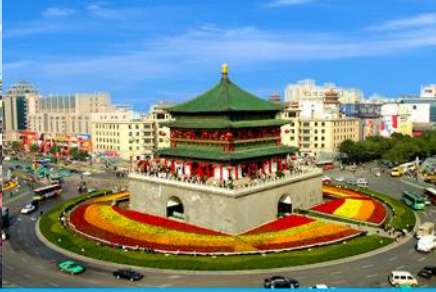
จัตุรัสหอกลอง