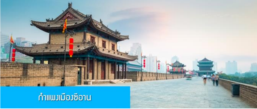
กำแพงเมืองซีอาน