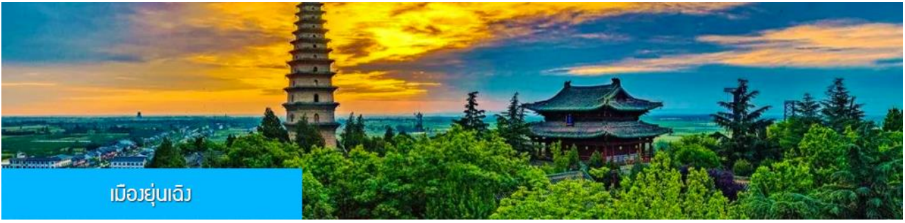
เมืองยูนเฉิง