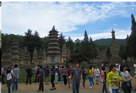
ป่าเจดีย์