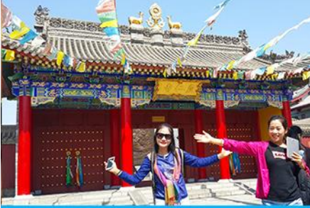
วัดลามะ หรือกว๋างเหรินชื่อ