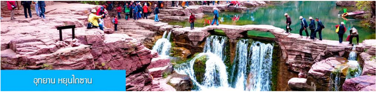
อุทยาน หยุ่นไถซาน

หลังอาหารนำท่านเที่ยวชม อุทยาน หยุ่นไถซาน 云台山 อุทยานท่องเที่ยวระดับ 5A ของจีนในมณฑลเหอหนานทางภาคกลางของจีน เป็นทั้งอุทยานท่องเที่ยวเชิงธรณีวิทยา และวนอุทยานท่องเที่ยวธรรมชาติที่ยังคงไว้ซึ่งผืนป่าที่สมบูรณ์ ด้วยลักษณะภูมิประเทศที่โดดเด่นสลักกับยอดเขาสูง มักมีเมฆหมอกปกคลุมทำให้เกิดเป็นทัศนียภาพที่สวยงามชวนหลงใหล จนเป็นที่มาของชื่ออุทยาน หยุ่นไถซาน ที่แปลว่า ภูเขาระเบียงเมฆ..... นำท่านเดินชมและเก็บภาพความสวยงามของภูเขา หน้าผา น้ำตก ธารน้ำในอุทยาน ฯ (ค่าทัวร์รวมค่ารถบัสรับส่ง และบันไดเลื่อนในอุทยาน) จนสมควรแก่เวลานำท่านเดินทางเข้าโรงแรมที่พัก