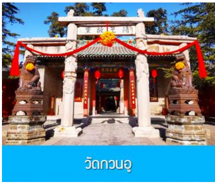
วัดกวนอู