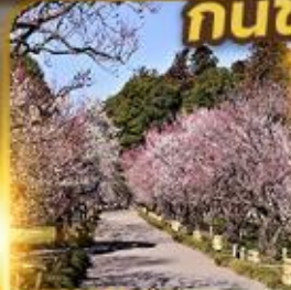
สวนโคราคูเอน