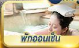
พักผ่อนเซ็น