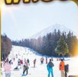
ลานสกีฟูจิกัน