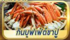
กินบุฟเฟ่ต์ชาบู