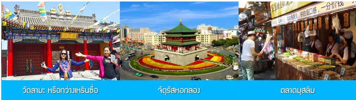
วัดลามะ: หรือกว้างเหรินชื่อ

นำท่านเดินทางโดยรถไฟความเร็วสูงขบวนที่ G1218 (16.20/17.47) สู่ เมืองซีอาน 西安 ขบวนรถไฟนำคณะเดินทางถึงสถานีรถไฟเมืองซีอาน นำท่านขึ้นรถบัสเดินทางเข้าเมืองซีอาน รับประทานอาหารค่ำ ณ ภัตตาคาร พักที่ โรงแรม HOLIDAY INN EXPRESS HOTEL 4* หรือเทียบเท่าระดับเดียวกันเมืองซีอาน