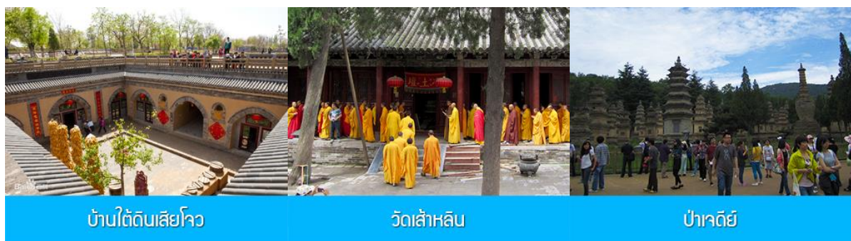
บ้านใต้ดินเสียโจว วัดเส้าหลิน ป่าเจดีย์

รับประทานอาหารค่ำ ณ ภัตตาคาร พักที่ VIENNA INTER HOTEL 4* หรือ โรงแรมในระดับเดียวกัน เมืองซานเหมินเสีย