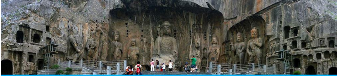
ถ้ำหินหลงเหมิน