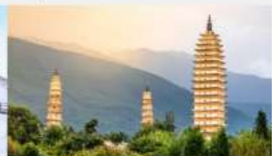
ระเบียงธารน้ำขาว "ไป๋สุ่ยโต"