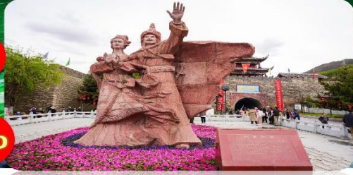
เมืองโบราณชงพาน