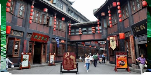
ถนนโบราณจิ้งหลี่

เมนูพิเศษ สุกี้เห็ด สุกี้หม่าล่า สุกี้หม่าล่า ซาบูไม้อัน 6 วัน 5 คืน เดินทาง : เทศกาลสงกรานต์