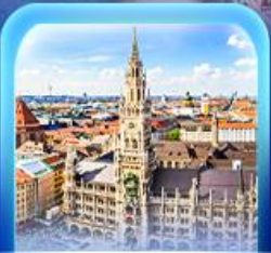
จัตุรัสมาเรียนพลัทซ์

เวียนนา ปราสาทนอยชวาสไตน์ ลูเซิร์น เซอร์แมท ชุก ซูริก