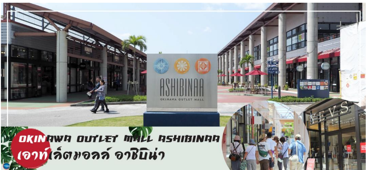
OKINAWA OUTLET MALL ASHIBINAA เออทเลตมอลล์ อาชิบิโนะ

เช้า รับประทานอาหารเช้า ณ ห้องอาหารของโรงแรม (5) นำท่านเดินทางสู่ ศาลเจ้านะมิโนะอุเอะ (Naminoue Shrine) (ใช้เวลาเดินทางประมาณ 10 นาที) ตั้งอยู่ ณ บริเวณที่เป็นพื้นที่ศักดิ์สิทธิ์ที่ใช้ในการสวดภาวนาอธิษฐานต่อเทพเจ้าที่สถิตย์อยู่ ณ อาณาจักรเจ้าสมุทรโพ้นทะเลมาแต่ครั้งโบราณ ในอดีตชาวเรือที่เข้าออก ณ ท่าเรือนาสะ (Naha Port) ซึ่งขณะนั้นเป็นศูนย์กลางการแลกเปลี่ยนค้าขายกับนานาประเทศ ทั้งจีน ประเทศทางตอนใต้ เกาหลี และชวายามาโตะ มักจะแหงนหน้ามองขึ้นไปยังศาลเจ้าซึ่งตั้งอยู่บนหน้าผาสูงเพื่ออธิษฐาน และแสดงความขอบคุณ ศาลเจ้านะมิโนะอุเอะได้รับความเสียหายจากการรบในโอกินาวะ (Battle of Okinawa) เมื่อครั้งสงครามแปซิฟิก แต่ได้รับการบูรณะฟื้นฟูในเวลาต่อมาเมื่อสงครามสิ้นสุดลง ปัจจุบันนี้ได้กลายเป็นศูนย์กลางแห่งศาสนาชินโตในจังหวัดโอกินาวะ ชาวญี่ปุ่นมักจะมาไหว้ขอพรเกี่ยวกับธุรกิจการงานให้เจริญรุ่งเรือง ร่ำรวย และมาสะเดาะเคราะห์ให้พ้นโชคร้าย จากนั้นนำท่านสู่ เออทเลตมอลล์ อาชิบิโนะ (Okinawa Outlet Mall Ashibinaa) (ใช้เวลาเดินทางประมาณ 30 นาที) เออทเลตแห่งแรกในโอกินาวะ รวบรวมร้านค้าชั้นนำกว่า 100 ร้าน ทั้งเสื้อผ้าแฟชั่น สินค้าแบรนด์เนม นาฬิกา ข้าวของเครื่องใช้ ของเล่น ทุกร้านจัดเต็มทั้งสินค้าน่ากดและรุ่นใหม่ ลดราคากระหน่ำกว่า 30-80% ให้ได้เดินช้อปปิ้งตัดท้ายทริปกันอย่างจุใจ ภายใต้บรรยากาศสบายๆ สไตล์รีสอร์ทริมทะเล หากข้อปจนเหนื่อยสามารถขึ้นไปทานอาหารที่ชั้น 2 มีอีกหลายร้านที่คอยให้บริการ