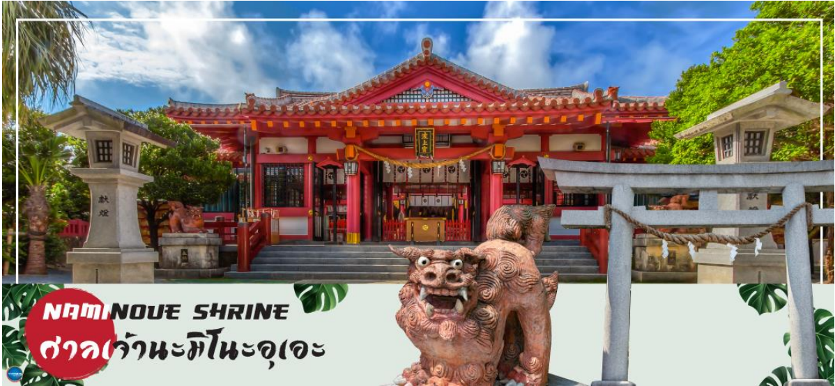
NAMINOUE SHRINE ศาลเจ้านะมิโนะอุเอะ

วันที่สี่ ศาลเจ้านามิโนะอุเอะ – อาชิบิโนะ เออทเลตมอลล์ – ทำอากาศยานนาสะ โอกินาวา – ทำอากาศยานดอนเมือง กรุงเทพฯ