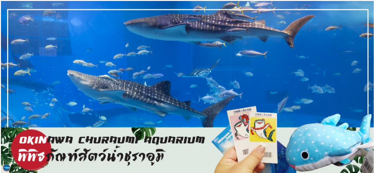
OKINAWA CHURAU MI AQUARIUM พิพิธภัณฑสัตว์น้ำชुरาอุมิ

เช้า รับประทานอาหารเช้า ณ ห้องอาหารของโรงแรม (1) นำท่านชม พิพิธภัณฑสัตว์น้ำชुरาอุมิ (OKINAWA CHURAU MI AQUARIUM) (ใช้เวลาเดินทางประมาณ 1.40 ชั่วโมง) เป็นพิพิธภัณฑสัตว์น้ำที่ดีที่สุดในประเทศญี่ปุ่น ไฮไลท์!!! ของการเยี่ยมชมพิพิธภัณฑสัตว์น้ำแห่งนี้คือแทงก์น้ำคโรซิโอะ ซึ่งเป็นหนึ่งใน แทงก์น้ำที่ใหญ่ที่สุดของโลก ซึ่งภายในนั้นเต็มไปด้วยสิ่งมีชีวิตในทะเลแถบโอกินาวาที่หลากหลาย สัตว์น้ำที่โดดเด่นที่สุดคือฉลามวาฬยักษ์ และกระเบนราหู อีสระให้ท่านได้เพลิดเพลินกับสัตว์น้ำหลากหลายชนิด ทั้ง ปลาตาว ฉลาม ฉลามเสือ และฉลามวัว ปลาเรืองแสง ตลอดจนหอยต่างๆ นอกจากนี้ยังมีสระน้ำกลางแจ้งที่ตั้งอยู่ใกล้ริมน้ำซึ่งเป็นที่จัดการแสดงของโลมาแสนรู้ เต่าทะเล และพะยูน ที่จัดขึ้นเพียงไม่กี่ครั้งต่อวัน (ไม่มีค่าใช้จ่ายเพิ่มเติม แต่ต้องตรวจสอบเวลาการแสดงก่อนชมนะคะ)