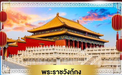
พระราชวังกู้ก