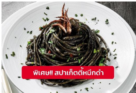
พิเศษ!! สปาเก็ตตี้หมึกดำ

เที่ยง ๑๐ รับประทานอาหารเที่ยง (มือที่9) เมนูพิเศษ!! สปาเก็ตตี้หมึกดำ