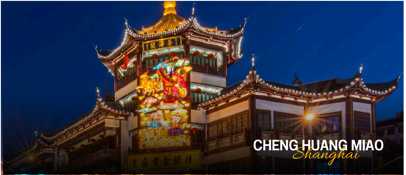
CHENG HUANG MIAO Shanghai