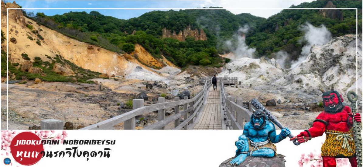
JIGOKUDANI NOBORIBETSU หุบเขานรกจิโกคุดานิ

วันที่สอง ท่าอากาศยานนิชิโตเสะ สอกไกโตะ – เมืองโนโบริเบทสึ – หุบเขานรกจิโกคุดานิ – เมืองฮาโกดาเตะ – ฮาโกดาเตะในทิว