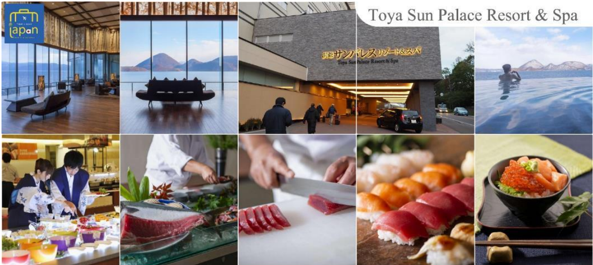
Toya Sun Palace Resort & Spa

--หลังอาหารให้ท่านได้ผ่อนคลายกับการแช่น้ำแร่ธรรมชาติ เชื่อว่าถ้าได้แช่น้ำแร่แล้ว จะทำให้ผิวพรรณสวยงามและช่วยให้ระบบหมุนเวียนโลหิตดีขึ้น--