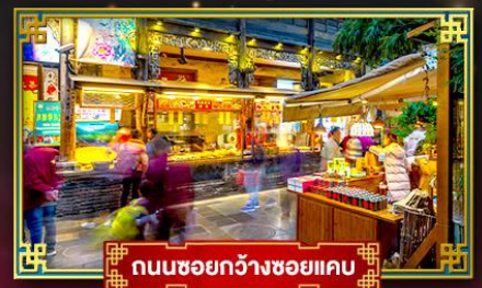
ถนนชอยกว้างชอยแคบ