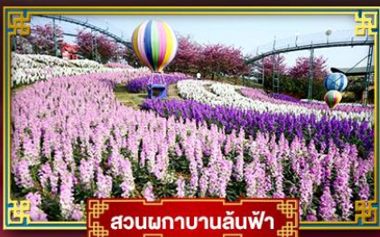
สวนดอกบานล้นฟ้า

อุทยานสวรรค์ภูผาหิมะการ์เซียต้ากู่ปิงชอน