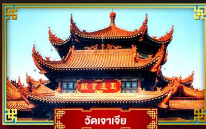
วัดจาเจีย