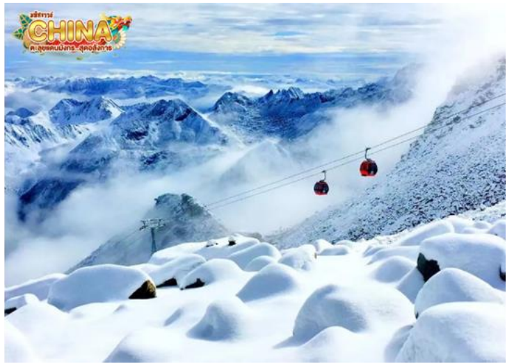
(หมายเหตุ: ปริมาณหิมะขึ้นอยู่กับสภาพอากาศ)