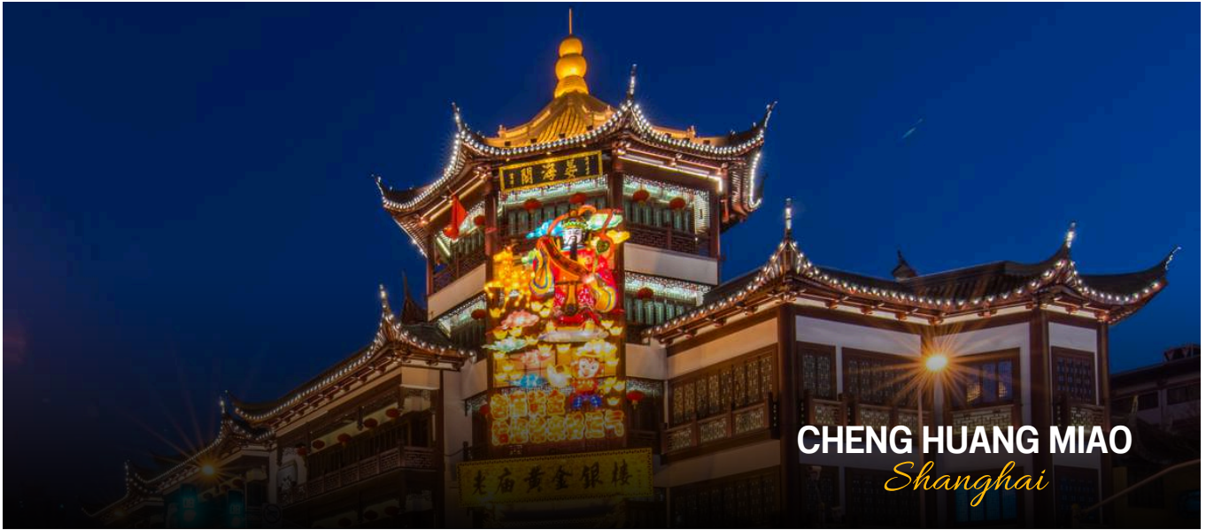
CHENG HUANG MIAO Shanghai