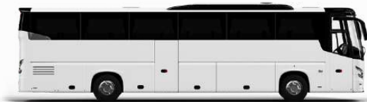
ตัวอย่างรถปรับอากาศ 1 ชั้น

ค่าที่พักตามที่ระบุในรายการหรือเทียบเท่าระดับเดียวกัน (พักห้องละ 2 ท่าน) หากประเภทห้องที่ท่านริเสกมาเต็ม อาทิ เช่น ริเสกห้องพักเป็น TWIN BED หรือ DOUBLE BED ทางบริษัทฯ ขอสงวนสิทธิ์ในการปรับประเภทห้องพัก เป็นตามโรงแรมมีอยู่ โดยไม่ต้องแจ้งให้ทราบล่วงหน้า