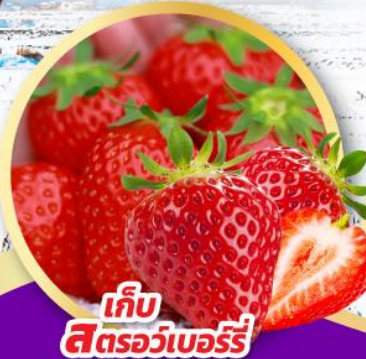
เก็บ สตอว์เบอร์รี่