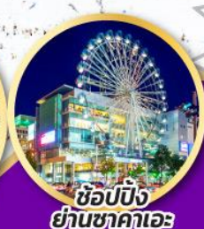
ช้อปบิง ย่านซาคาเอะ

สัมผัสความมหัศจรรย์ฮาคุบะ พร้อมชมวิวแบบ 360 องศา