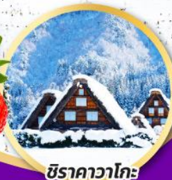
ชิราคาวาโกะ