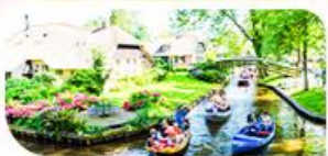
ล่องเรือชมหมู่บ้านที่โรธัม

เยอรมัน เนเธอร์แลนด์ เบลเยียม ฝรั่งเศส Keukenhof