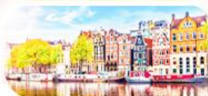
คลองอัมสเตอร์ดัม