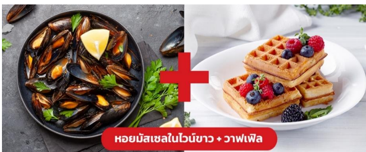
หอยมัสเซลในไวน์ขาว + วาฟเฟิล

เย็น ๑๐ | รับประทานอาหารเย็น (มือที่9) เมนูพิเศษ! หอยมัสเซล + วาฟเฟิล (Mussel in White wine + Waffle)