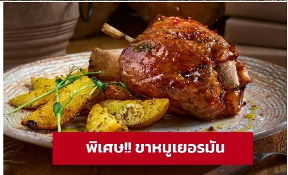
พิเศษ!! ขาหมูเยอรมัน

เย็น 🍴 รับประทานอาหารเย็น (เนื้อกึ่ง) เมนูพิเศษ! ขาหมูเยอรมัน ที่พัก : Mercure Hotel Frankfurt Eschborn หรือโรงแรมและเมืองระดับใกล้เคียงกัน (ชื่อโรงแรมที่ท่านพัก ทางบริษัทจะทำการแจ้งพร้อมใบนัดหมาย 5-7 วันก่อนวันเดินทาง)