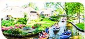
ล่องเรือชมหมู่บ้านที่โรธัม