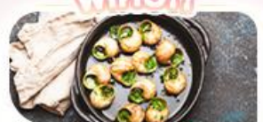
ของแถมเสตคัท