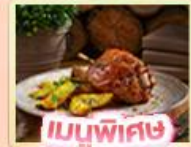
เมนูพิเศษ วาทมูเยอร์มิน