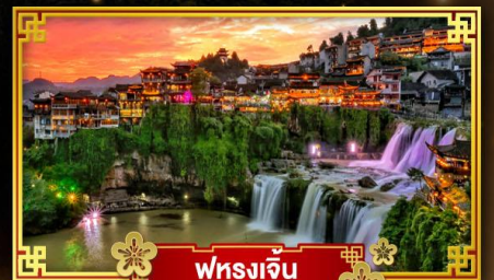
ฟุหลงเจิ้น