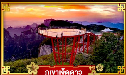
กูเขาเจ็ดดาว