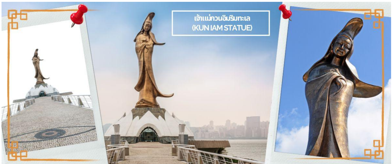
เจ้าแม่กวนอิมริมทะเล (KUN IAM STATUE)

CTGHKG1 ฮ่องกง-มาเก๊า ซึ่ข่องรอย ไหว้ 3 เจ้าแม่กวนอิม 3วัน 2คืน THAI AIRWAYS (TG) (MAR-DEC 25)