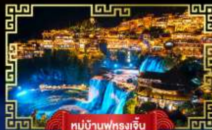
หมู่บ้านฟูหลงเจิน