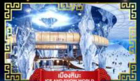
เมืองหิมะ: ICE AND SNOW WORLD