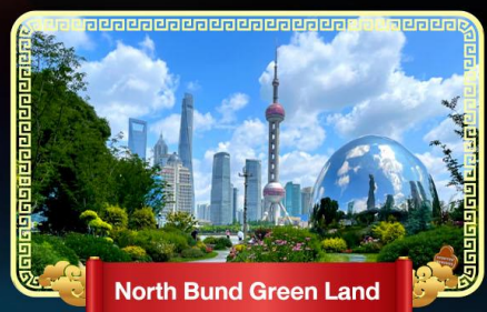
North Bund Green Land