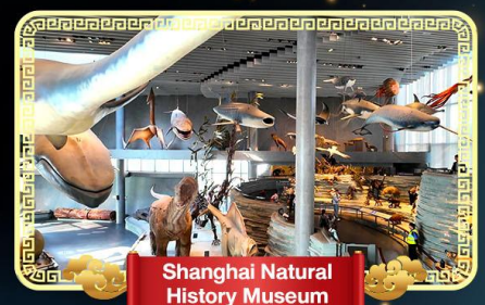
Shanghai Natural History Museum