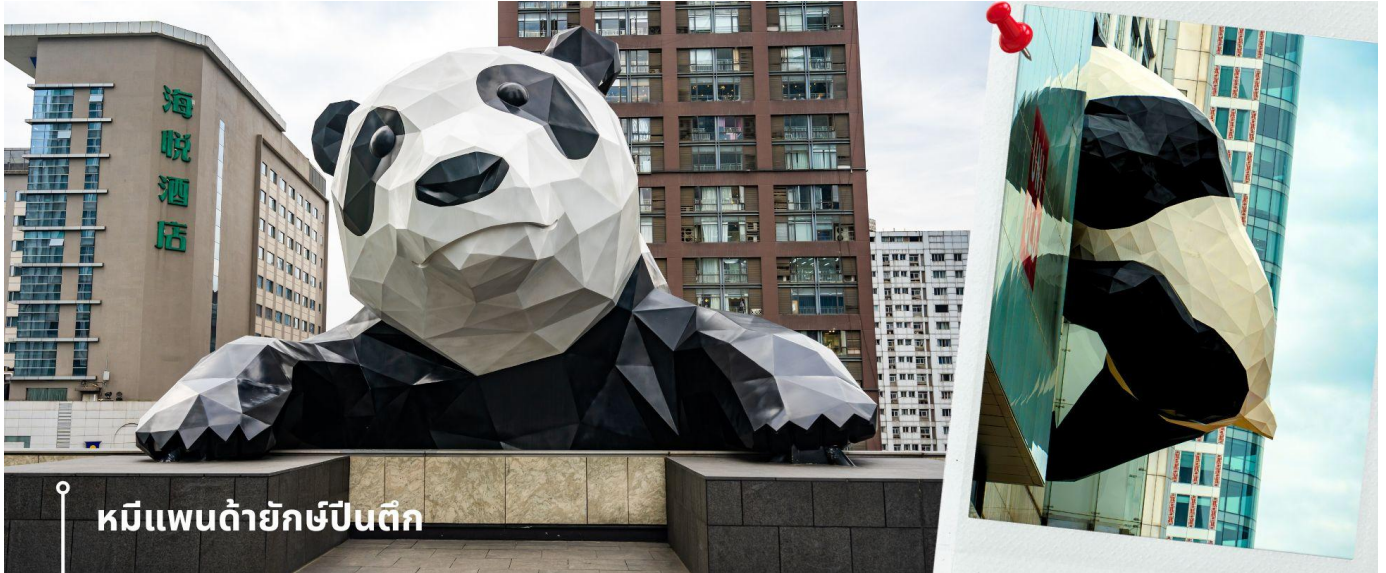
หมีแพนด้ายักษ์ป็นตึก

ป็นตึก และมีส่วนหัวที่โผล่พ้นออกมาจากอาคาร ทำให้เกิดภาพอันน่ารักและน่าประทับใจจากผู้ที่พบเห็นและนักท่องเที่ยว