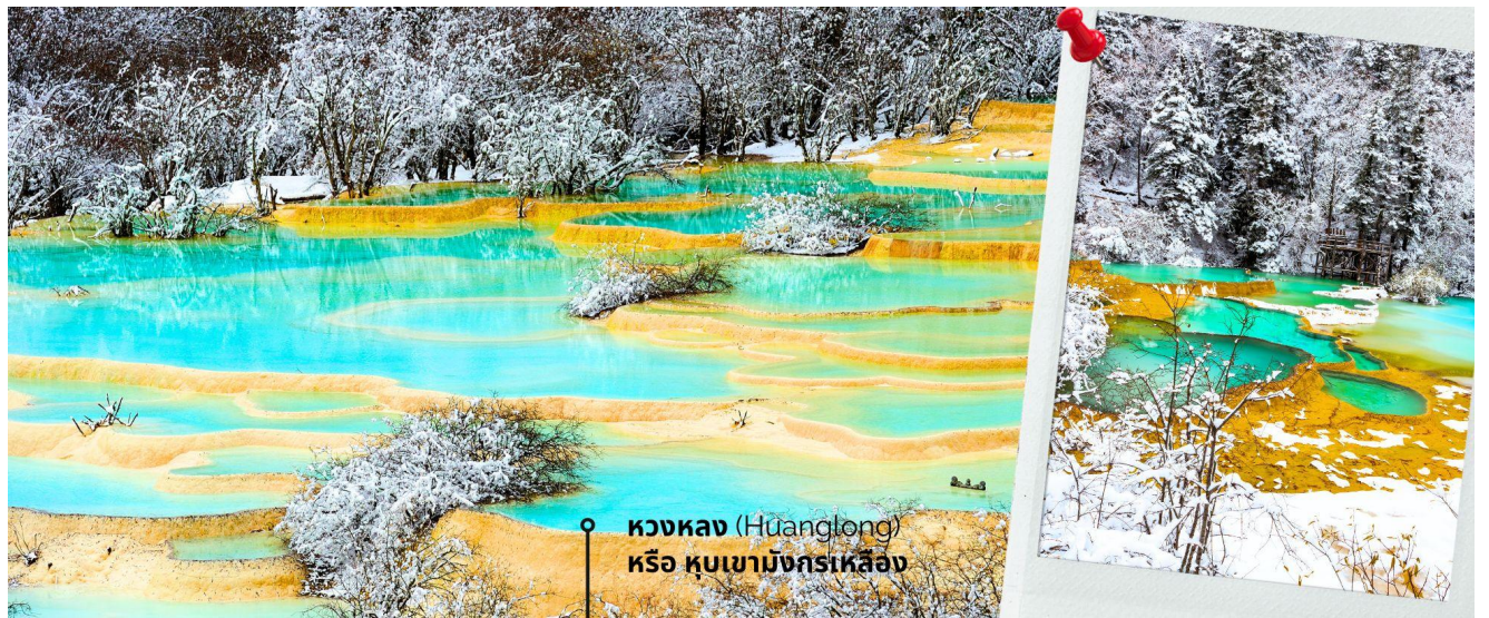
หวงหลง (Huanglong) หรือ หุบเขามังกรเหลือง

เที่ยง 📍 รับประทานเที่ยง ณ ภัตตาคาร (6) หวงหลง (Huanglong) หรือ หุบเขามังกรเหลือง (รวมค่ากระเช้าขึ้น-ลง หวงหลงและรถแบตเตอรี่) ที่ได้รับการขึ้นทะเบียนเป็นมรดกโลก รายล้อมไปด้วยแอ่งน้ำสีฟ้าจำนวนนับไม่ถ้วน และภูเขาสูงใหญ่สลับซับซ้อน อุทยานหวงหลง (Huanglong Scenic and Historic Interest Area) หรือ หุบเขามังกรเหลือง แหล่งธรรมชาติที่อุดมสมบูรณ์บนเทือกเขา Minshan Mountains มีระบบนิเวศที่หลากหลาย ทั้งน้ำพุร้อน น้ำตก แอ่งน้ำหินปูน รวมถึงเป็นแหล่งของพืชพรรณนานาชนิด และสัตว์ป่าใกล้สูญพันธุ์อย่าง แพนด้ายักษ์ และ ลิงมงกุฎเชดสีทอง เป็นต้น ที่สำคัญยังมีทัศนียภาพที่สวยงามที่ราวกับเป็นดินแดนสวรรค์ ด้วยคุณสมบัติเหล่านี้ อุทยานหวงหลงจึงได้รับการขึ้นทะเบียนเป็นมรดกโลกโดยองค์การ UNESCO เมื่อปี ค.ศ. 1992