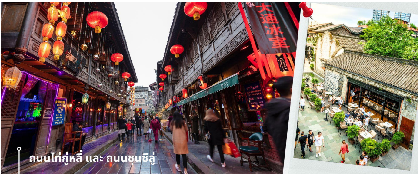
ถนนไท่กุ่หลี่ และ ถนนชุนชี่ลู่

จากนั้นให้ท่านให้อิสระกับการเลือกซื้อสินค้าของฝากที่ ถนนไท่กุ่หลี่ และ ถนนชุนชี่ลู่ ในย่านนี้เป็นถนนโบราณ ในอดีตเคยโรงงานผลิตผ้าไหมใหญ่ที่สุดในจีน ปัจจุบันได้เปลี่ยนเป็นถนนช้อปปิ้งแหล่งสวรรค์ของนักท่องเที่ยว เป็นถนนคนเดิน มีห้างสรรพสินค้าชื่อดัง มีร้านค้ามากกว่า 700 ร้านค้าที่เต็มไปด้วยสินค้าต่าง ๆ ทั้งร้านค้าแฟชั่น ร้านอาหารและโรงแรมนานาชาติมากมายซึ่งเป็นที่เที่ยวเชิงดูที่มีการเชื่อมต่อทางวัฒนธรรมท้องถิ่นที่เป็นแหล่งช้อปปิ้งและเป็นแหล่งร้านอาหารที่อร่อยต่าง ๆ มากมาย ซึ่งเป็นสถานที่เที่ยวของเมืองดูที่ทำให้เพลิดเพลินกับสินค้าแบรนด์เนมและแบรนด์จีน