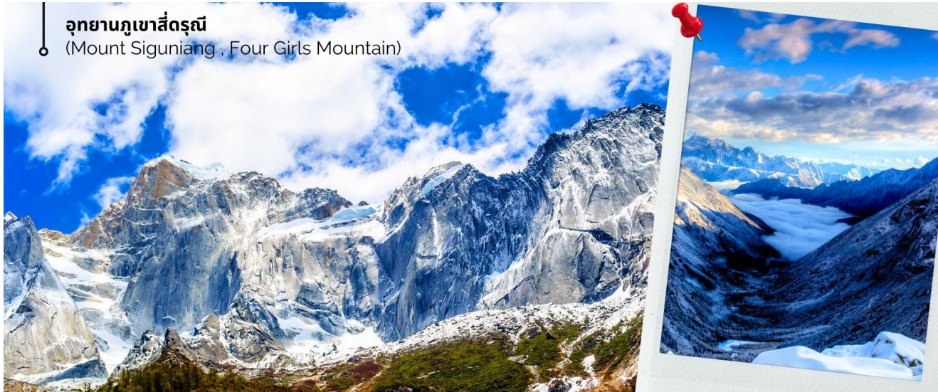
อุทยานภูเขาสี่ดรุณี (Mount Siguniang , Four Girls Mountain)