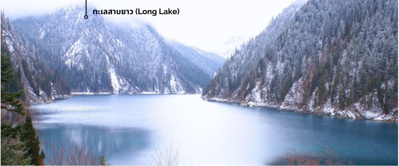
ทะเลสาบยาว (Long Lake)

ทะเลสาบที่ใหญ่ที่สุด สูงที่สุด และลึกที่สุดในจิวจ้ายโกว ด้วยเนื้อที่กว่า 581 ไร่ ความยาวกว่า 7 กิโลเมตร และลึกถึง 103 เมตร ทอดตัวโค้งเป็นรูปพระจันทร์เสี้ยว เนื่องจากหิมะบนภูเขาละลายลงมา น้ำในทะเลสาบสีฟ้าสวยงาม ล้อมรอบด้วยยอดเขาสูงชัน และต้นไม้ใหญ่ที่ปกคลุมด้วยหิมะ งดงามราวหลุดออกมาจากภาพวาด ความพิเศษในช่วงฤดูหนาว ทะเลสาบจะกลายเป็นน้ำแข็งหนากว่า 60 เซนติเมตร ทำให้นักท่องเที่ยวนิยมมาเล่นสเก็ตน้ำแข็งกันเป็นจำนวนมาก