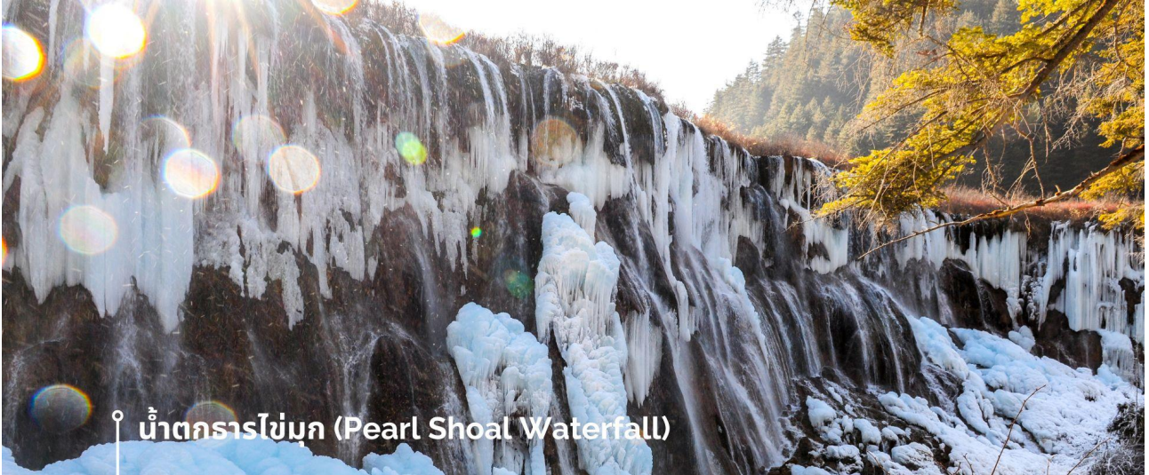
น้ำตกธารไข่มุก (Pearl Shoal Waterfall)

จากแสงแดดที่สะท้อนกับละอองน้ำอีกด้วย หากได้มาในช่วงฤดูหนาว ก็จะได้เห็นหิมะเกาะตามต้นไม้ โขดหิน และถ้าอากาศหนาวมากๆ น้ำที่น้ำตกก็จะกลายเป็นน้ำแข็ง กลายเป็นประติมากรรมจากธรรมชาติที่สวยงาม