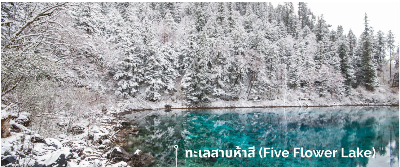
ทะเลสาบห้าสี (Five Flower Lake)

หนึ่งในจุดที่สวยงามและนักท่องเที่ยวแวะมาเยี่ยมชมเยอะที่สุด ตั้งอยู่ที่ความสูงเหนือระดับน้ำทะเลประมาณ 2,472 เมตร น้ำลึกประมาณ 5 เมตร น้ำใสจนเห็นพื้นด้านล่างของทะเลสาบ สีของผิวน้ำสวยงามแปลกตา โดยเฉพาะเมื่อยามแสงอาทิตย์สาดส่องกระทบผิวน้ำ สีของน้ำในทะเลสาบจะสะท้อนเป็นสีส้มถึง 5 เฉดสี สวยงามสะกดตา ซึ่งสาเหตุที่ทำให้เกิดสีส้มต่างๆ นี้มาจากการสะสมของแร่ธาตุ และพีชน้ำชนิดต่างๆ โดยจะมีสีส้มแตกต่างกันไปตามฤดูกาลและช่วงเวลา ยิ่งถ้ามาในช่วงฤดูหนาว ต้นไม้ริมทะเลสาบจะเต็มไปด้วยหิมะสีขาวตัดกับสีของทะเลสาบ ดูสวยงามแปลกตา