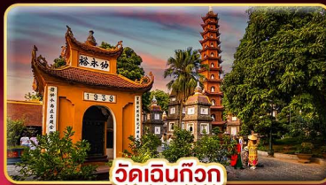
วัดเงินทิว