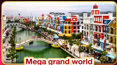
Mega grand world