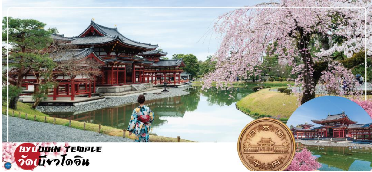
BYODOIN TEMPLE วัดเบียวโดอิน

วันที่สอง ท่าอากาศยานนานาชาติคันไซ โอซาก้า ประเทศญี่ปุ่น – เมืองเกียวโต – เมืองอุจิ – วัดเบียวโดอิน (จุดชมซากุระขึ้นกับภูมิอากาศ) – ถนนเบียวโดอิน โอโมเตะซันโด (ถนนชาเขียว) – สะพานอุจิ – เมืองนาโกย่า – ซุปป์งย่านซาคาเอะ