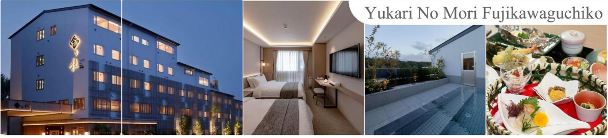
Yukari No Mori Fujikawaguchiko