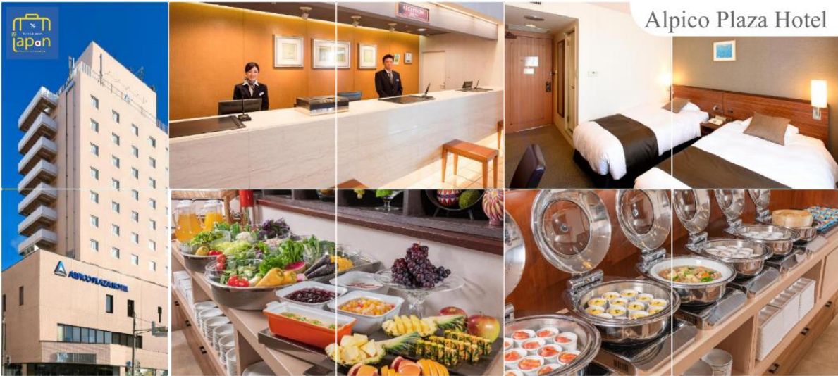
Alpico Plaza Hotel

พักที่ ALPICO PLAZA HOTEL หรือเทียบเท่าระดับเดียวกัน