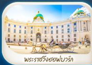
พระราชวังฮอฟบวร์ก

12-18 มี.ค.68 / 19-25 มี.ค.68 28 เม.ย. - 4 พ.ค.68 7-13 พ.ค.68