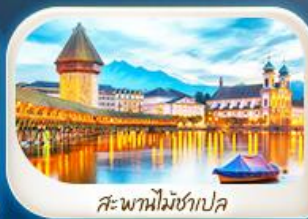
สะพานไมซ์าเปค