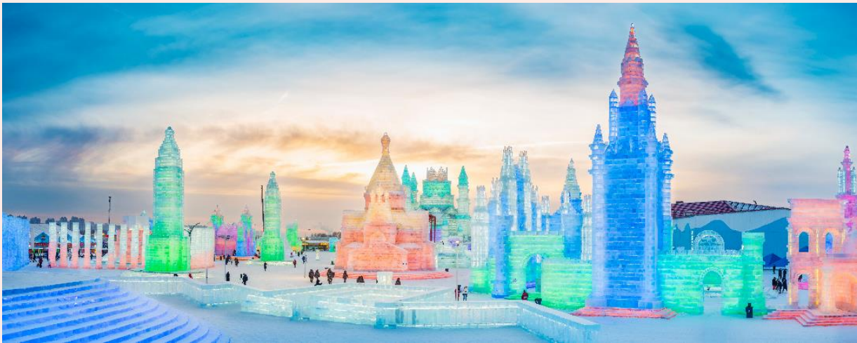
ภายในบริเวณงาน Harbin International Ice and Snow Festival มีรถไฟฟ้าบริการ ท่านละประมาณ 50 หยวน ทั้งนี้โปรดสอบถามราคาและการบริการอีกครั้ง เนื่องจากในแต่ละปีเงื่อนไขการให้บริการต่างกันออกไป

จากนั้นนำท่านชมความยิ่งใหญ่ของงานฤดูหนาวระดับโลก เทศกาลแกะสลักหิมะและน้ำแข็งแห่งเมืองฮาร์บิน ที่ใหญ่ที่สุดในโลก Harbin International Ice and Snow Festival ซึ่งใน 1 ปีจะจัดขึ้นเพียงครั้งเดียวเท่านั้น ถ่ายรูปกับประติมากรรมน้ำแข็งสุดอลังการที่ถูกแกะสลักโดยช่างฝีมือดีจากทั่วทุกมุมโลก โดยนำก้อนน้ำแข็งหลายหมื่นก้อนมาแกะสลักเพื่อประกอบเป็นรูปร่างต่างๆ จนกลายเป็นเมืองที่เหมือนหลุดออกมาจากเทพนิยาย มีปราสาทขนาดใหญ่สวยงามตระการตา ยามค่ำคืนจะเปิดไฟสีอันสวยงาม นอกจากถ่ายรูปสวยๆ ยังมีกิจกรรมอื่นๆ ที่น่าสนใจมากมาย เช่น นั่งรถม้าเที่ยวชมรอบๆ การเล่นสไลด์เดอร์น้ำแข็ง การเล่นกระดานลื่นน้ำแข็ง ถอดเสื้อผ้าว่ายน้ำในสระน้ำท่ามกลางอากาศที่ติดลบมากกว่า -20 องศา การเล่นไอซ์สเกต การเดินเข้าซามถ้ำน้ำแข็ง เป็นต้น (หมายเหตุ : เทศกาลแกะสลักหิมะ และน้ำแข็งแห่งเมืองฮาร์บิน ในแต่ละปีการแกะสลักรูปแบบอาจจะแตกต่างกันออกไป สำหรับการจัดงานในปี 2025 จะเปิดอย่างเป็นทางการในวันที่ 5 มกราคม 2568 แต่จะเริ่มเข้าชมได้ตั้งแต่ช่วงการเตรียมงาน คือ วันที่ 10 ธันวาคม 2567 ไปจนถึงประมาณปลายเดือนกุมภาพันธ์ หรือจนกว่าหิมะจะละลาย)