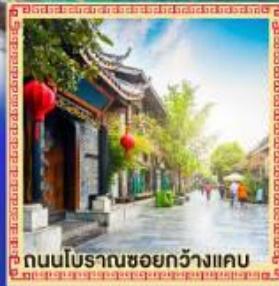
ถนนโบราณชอยกว้างแคบ