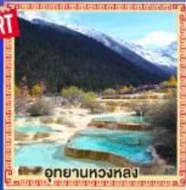
อุทยานหลวงหลง