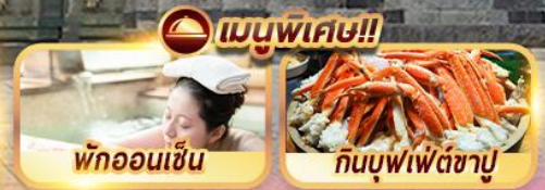
พักออนเซ็น