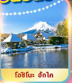
โอะชิโนะ ฮกไกโด