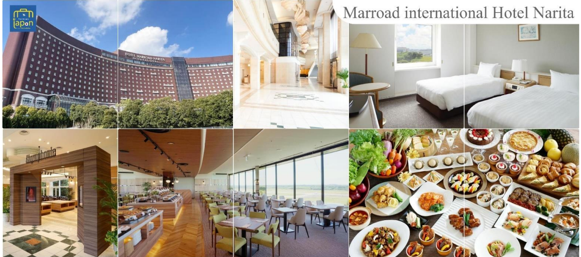
Marroad international Hotel Narita

พักที่ MARROAD INTERNATIONAL HOTEL NARITA หรือเทียบเท่าระดับเดียวกัน