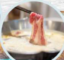
เมนูพิเศษ สุกี้หม่าล่า