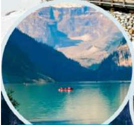
ทะเลสาบเต๋ยซี