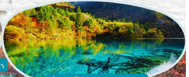
จิวจ้ายโกว รวมรถส่วนตัว