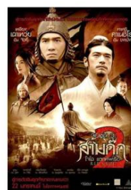
ภาพยนตร์และซีรีส์ชื่อดัง ถ่ายทำที่ Hengdian World Studios