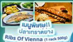
เมนูพิเศษ! ปลาเทราต์ย่าง Ribs Of Vienna (1 rack 500g)