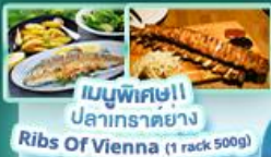
เมนูพิเศษ! ปลาเทราต์ย่าง Ribs Of Vienna (1 rack 500g)