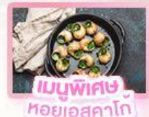
เมนูพิเศษ หอยเอสคาโท

เยอรมัน เนเธอร์แลนด์ เบลเยียม ฝรั่งเศส Keukenhof