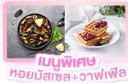
เมนูพิเศษ หอยมีสซอล+วาฟเฟิล