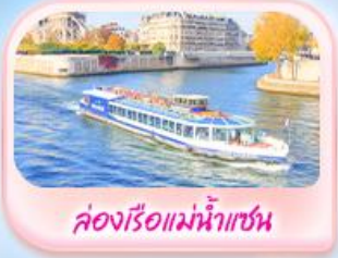
คลองเรือแม่น้ำแซน