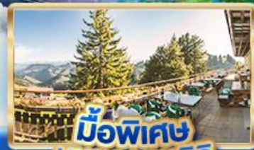
มือพิเศษ บeyond เวนริค