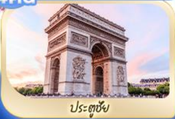
ประตูชัย