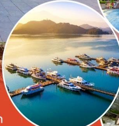
ทะเลสาบสุริยอันจันทร์