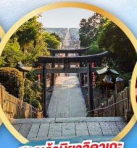
ศาลเจ้ามียาจิดากะ