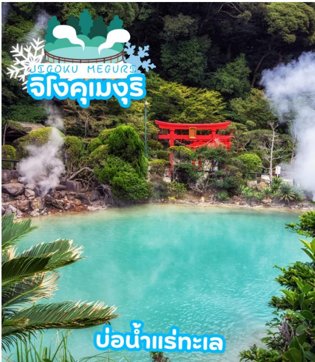
บ่อน้ำแร่ทะเล

ได้เวลาอันสมควรนำท่านเดินทางสู่ เมืองเบปปุ (Beppu) เมืองในจังหวัดโออิตะ (OITA) ตั้งอยู่บนชายฝั่งทะเลตะวันออกของเกาะคิวชู ประเทศญี่ปุ่น เป็นเมืองท่องเที่ยวแช่น้ำพุร้อนยอดนิยมของญี่ปุ่น จัดเป็นเมืองที่มีรีสอร์ทน้ำแร่มากที่สุด นักท่องเที่ยวนิยมมาแช่ออนเซนหรืออบทรายร้อนริมทะเลที่เมืองนี้