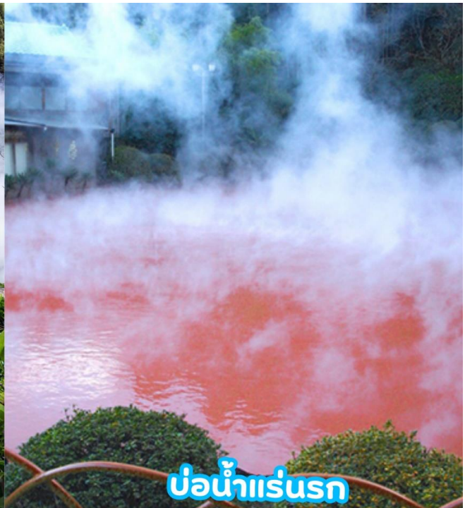
บ่อน้ำแร่บุรก

GO2FUK-VZ006 – KYUSHU KUMAMOTO OITA SKI WINTER 5D3N VZ