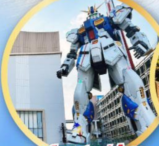
กันดั้ม ปาร์ค ฟุคุโอกะ

เดินทาง 09-13, 16-20, 23-27 ม.ค.68 06-10, 13-17, 20-24 ก.พ. 68 07-10 มี.ค. 68