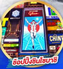
ซ้อปิ้งซินโซบาชิ

เดินทาง 14-19, 21-26 ม.ค. 68 06-11, 13-18 ก.พ. 68 13-18 มี.ค. 68