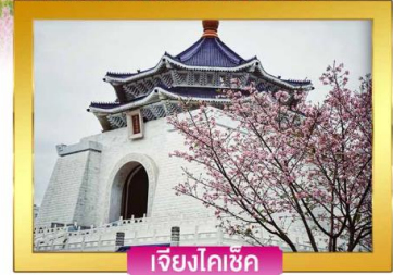
เจียงโคเช็ก