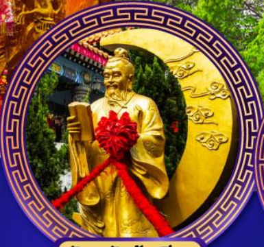
วัดหวังคำเซียน