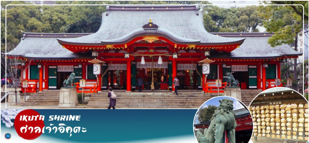
IKUTA SHRINE ศาลเจ้าอิคุตะ

จากนั้นนำท่านสักการะ ศาลเจ้าอิคุตะ (Ikuta Shrine) ตั้งอยู่ในย่านใจกลางเมืองซันโนะมียะ (Sannomiya) เป็นศาลเจ้าที่มีประวัติศาสตร์ยาวนาน ก่อตั้งในปี 201 หนึ่งในสามศาลเจ้าหลักของ โกเบที่มีประวัติศาสตร์ยาวนานกว่า 1,800 ปี ทางเหนือไปตามถนนชื่อถนนอิคุตะ คุณจะเห็นทางเข้า ศาลเจ้าพร้อมประตูโทริอิที่สร้างโดยใช้วัสดุรีไซเคิลจากศาลเจ้าใหญ่อิเสะ ศาลเจ้าอิคุตะมีชื่อเสียงใน ด้านผลประโยชน์ในการจับคู่ เนื่องจากจิตอาหิ อนุชนเป็นเทพเจ้าผู้ทอเสื้อผ้าของเทพเจ้า และเธอ ทอด้ายและด้ายเข้าด้วยกัน คนในพื้นที่เรียกกันอย่างเสนาหว่า "อิคุตะซัง"