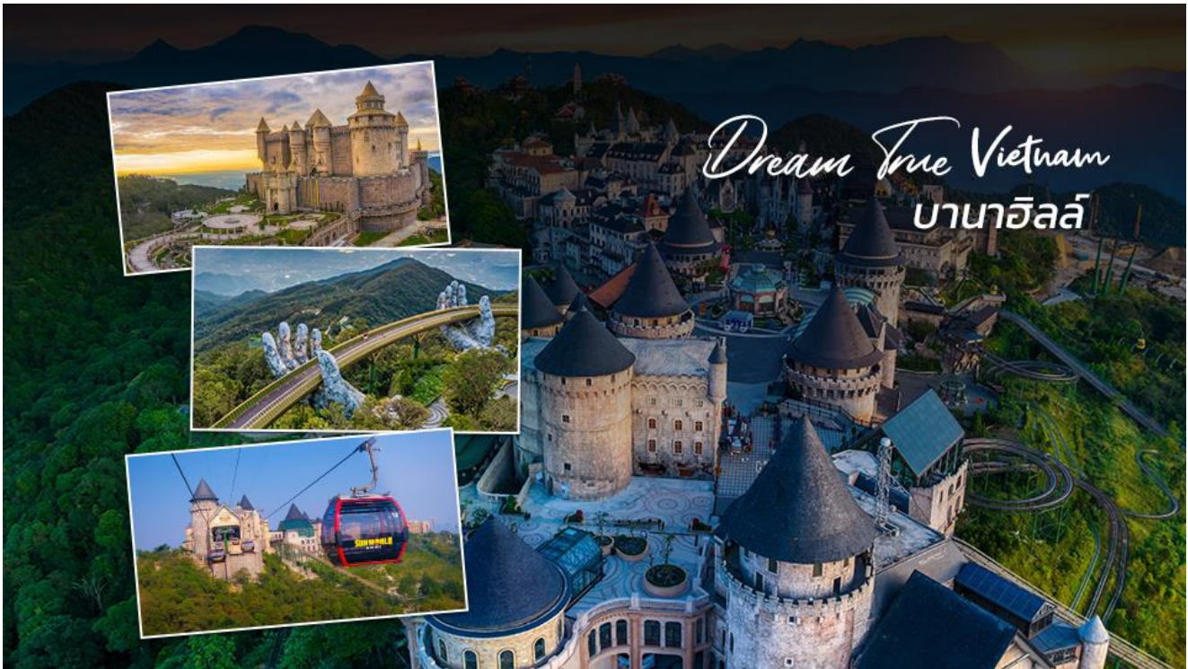
AD-DAD081-VZ_DANANG_3D2N_NOV 24 - MAR 25 เที่ยวบานาฮิลล์เต็มวัน

📍 จากนั้นทำท่านเดินทางสู่ บานาฮิลล์ ( Ba Na Hill ) สถานที่ท่องเที่ยวและพักผ่อน สไตล์หมู่บ้านฝรั่งเศส ตั้งอยู่บนเขาที่ระดับความสูง 1,487 เมตร ทำให้มีสภาพอากาศที่เย็นสบายตลอดทั้งปี นำท่านนั่ง กระจะเข้าขึ้นไปสู่เมืองบนยอดเขาบานาฮิลล์ ซึ่งได้รับการบันทึกสถิติโลกว่าเป็น กระจะเข้าไฟฟ้าที่มีระยะทางยาวที่สุดในโลก (5,042 เมตร) และสูงที่สุดในโลก (1,368 เมตร) ระหว่างทางขึ้นท่านจะได้สัมผัสกับความสวยงามของทัศนียภาพโดยรอบของเทือกเขา เมื่อนั่ง กระจะเข้าขึ้นไปถึงยอดเขา ปราสาทย้อนยุคสไตล์ฝรั่งเศสสวยงามเหมือนอยู่ในเทพนิยาย มีมุมถ่ายรูปมากมาย จุดที่เป็นไฮไลท์ คือ สะพานมือยักษ์ลอยฟ้า Golden Bridge ที่สามารถมองเห็นวิวจากมุมสูง และสัมผัสหมอกอย่างใกล้ชิด และยังมีเครื่องเล่นให้ได้สนุกสุดเหวี่ยงที่ Fantasy Park มี (รวมค่าเครื่องเล่นบนสวนสนุก) ***ไม่รวมค่าเข้าชมหุบเข้ผึ้ง ที่เป็นส่วนหนึ่งของบานาฮิลล์จะมีเครื่องเล่นในหลายรูปแบบท้าทายมากมาย ความมันส์ของหนัง 4D, ระทึกขวัญกับบ้านผีสิง และอื่นๆ เกมส์สนุกๆเครื่องเล่นเบาๆรถไฟเหาะแมงมุมเวียนหัว ตลอดไปจนถึงระทึกขวัญสั่นประสาทอีกมากมาย หรือ ซอปปิงช้อปปิ้งของที่ระลึก