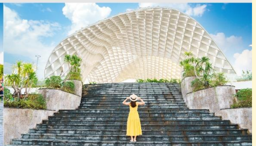
สวนเอเปค

*กรณีห้องพักรับบานาฮิลล์เต็ม ขอสงวนสิทธิ์ในการเปลี่ยนวันเข้าพัก และปรับเปลี่ยนโปรแกรมโดยคำนึงถึงผลประโยชน์ลูกค้าเป็นสำคัญ