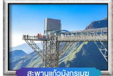
สะพานแก้วมิงกรเมซ