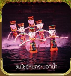
ชมโชว์หุ่นกระบอกน้ำ