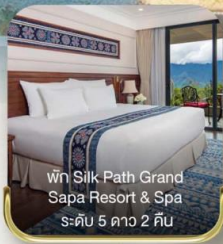
พัก Silk Path Grand Sapa Resort & Spa ระดับ 5 ดาว 2 คืน