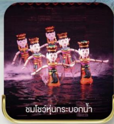
ชมโชว์หุ่นกระบอกน้ำ