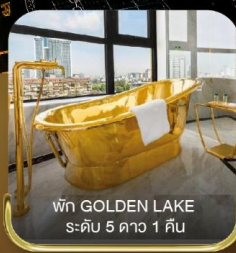
พัก GOLDEN LAKE ระดับ 5 ดาว 1 คืน