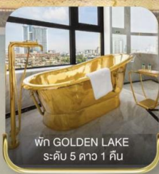
พัก GOLDEN LAKE ระดับ 5 ดาว 1 คืน