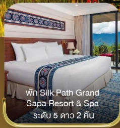
พัก Silk Path Grand Sapa Resort & Spa ระดับ 5 ดาว 2 คืน